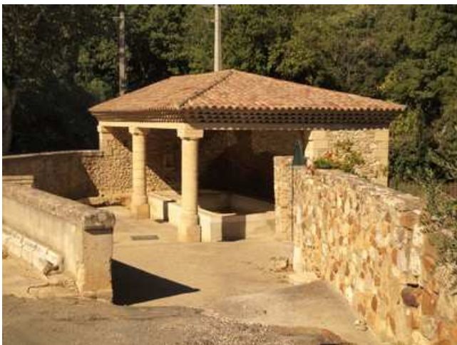
Charmant lavoir à Pognadoresse

② Avant de partir à gauche et de suivre le balisage, nous nous proposons de parcourir les ruelles. L'appareil photo s'avère totalement indispensable, tant les bâtisses, le château et ses remparts, et le socle rocheux rougeâtre sur lequel est construite l'agglomération sont rares de beauté. Après cette visite, nous rejoignons vers l'Ouest la section balisée qui passe à gauche d'un charmant lavoir. Nous prenons la petite route mais nous la délaissions peu après au profit d'un chemin raviné descendant rejoindre le goudron en évitant la courbe goudronnée. Nous enjambons alors pour la première fois le cours d'eau la Tave et nous suivons cette petite route qui va se diriger vers l'Ouest.