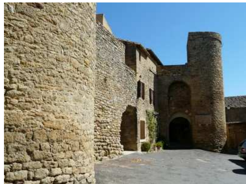
Le fort de Saint-Laurent-la-Vernède

⑦ C'est alors qu'il nous faut partir à gauche sur un axe plus tranquille qui nous permet, en allant à droite après 400 m, d'arriver au village. Ici, la surprise est de taille. En effet, la vieille agglomération s'avère être une ancienne forteresse protégée par d'imposantes murailles toujours présentes. Nous parcourons alors les ruelles de ce fort. Ce n'est pas grand mais c'est étonnant.