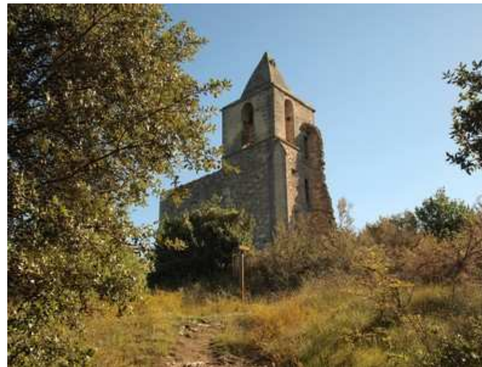
La chapelle Saint-Jean-d'Orgerolles

Le département du Gard est riche de très pittoresques villages. Bien des maisons anciennes sont construites avec la pierre de pays. Compte tenu de la richesse géologique ici, les couleurs sont d'une rare variété. Ce circuit, de 14 km et de 200 m de dénivelée, va permettre la rencontre de trois villages méconnus avec, pour chacun, une originalité surprenante. Du parking, nous prenons la direction Pougnadoresse par la D211. Ceci jusqu'à la sortie du village. Nous y rencontrons des panneaux indicatifs et directionnels. Nous devons nous rendre, dans un premier temps, à la chapelle St-Jean-d'Orgerolles. Pour cela, nous partons à gauche en suivant un balisage jaune. Peu après, nous délaissions le goudron pour nous engager à droite sur le chemin se rendant jusqu'aux ruines de cette chapelle. Il s'agit d'un sentier boisé de toute beauté qui nous mène au pied de la butte sur laquelle se dressent de magnifiques vestiges, dont la tour-clocher visible de loin.