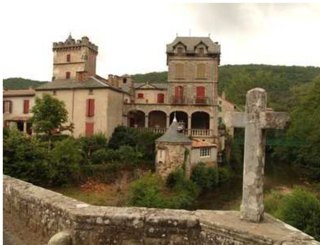
Le château de Saint-Maurice-de-Sorgues

❶ Nous avons décidé ensemble de pénétrer dans la forêt à gauche sur un chemin dont une chaîne barre le passage des véhicules. Il démarre 100 m après la fourche. C'est le début d'une légère ascension de 370 m de dénivelée sur un circuit d'environ 13 km. La pente est régulière mais la piste, au départ, est très peu entretenue. Un premier crochet à droite, puis un autre à gauche, et nous arrivons à une bifurcation. Continuons à droite jusqu'à atteindre une piste bien plus entretenue et plus large.