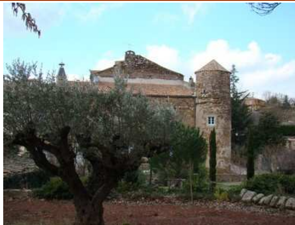
Le très beau château de St-Jean-de-la-Blaquière