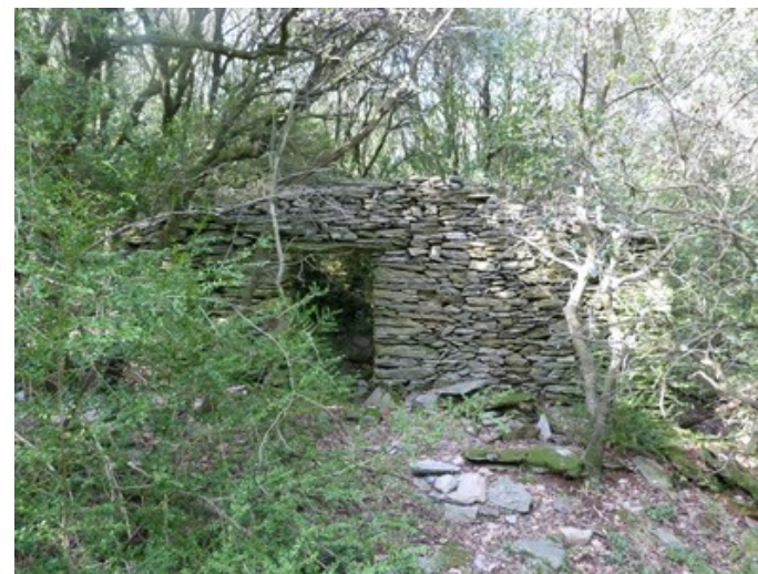
En descendant dans les schistes

⑧ Toutefois attention car il nous faut la quitter pour un sentier à gauche qui va descendre conséquemment et arriver enfin en plaine. C'est ensuite une piste à laquelle succède le goudron et, par une rue du village désert, nous arrivons directement face à notre parking.