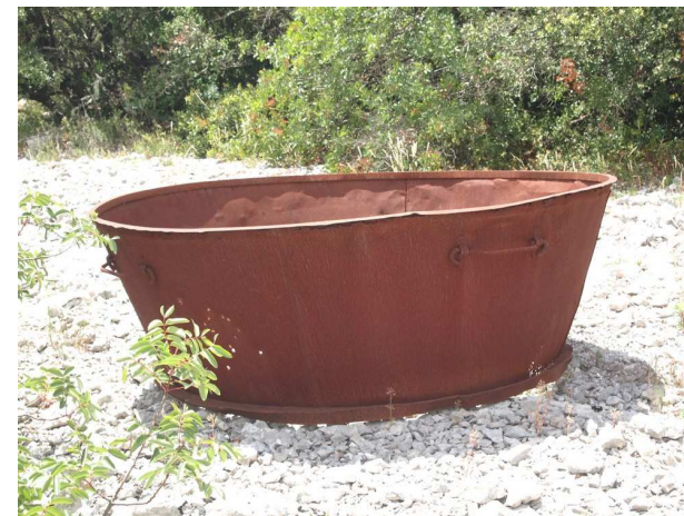
Ancienne coiffe de charbonnière

3 Enfin, nous voici au niveau d'une imposante clôture renforcée de couleur verte. Un chemin partant à gauche alors que la direction de l'Ouradou part à droite. En fait, ici, nous choisissons de partir déjà à gauche par ce chemin qui descend quelque peu vers une courbe dominant majestueusement les gorges de l'Hérault. Les vues sont sublimes aussi bien vers le mont St Baudile que vers le roc de la Vigne, la Séranne et tant d'autres points remarquables. Nous passons ensuite devant l'entrée « bunkérisée » qui permet, pour les propriétaires du domaine Les Chambrettes de rejoindre leurs habitations visiblement en travaux actuellement. Après cette boucle, nous retrouvons le point 3 et continuons notre progression vers l'objectif.