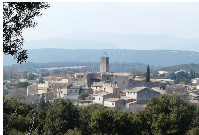
La jolie circulade de Puechabon

Nos appréciations : compte tenu de l'environnement général, ce circuit est à déconseiller fortement en cas de grande chaleur. Par contre, aussi bien à l'automne qu'en début de printemps, mais aussi en plein hiver, il présente un grand intérêt, notamment du fait des panoramas exceptionnels. Se munir d'une bonne réserve d'eau, et n'oubliez pas votre appareil photo. En fin de randonnée, la découverte de la charmante petite circulade de Puechabon est vivement conseillée.