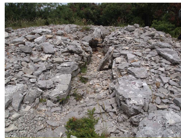
Un dolmen ruiné et son tumulus

② Nous suivons toujours les plots métalliques verts dans cette zone boisée autant que peut l'être une garrigue de chênes verts. En cette mi-juin, de très nombreuses variétés de plantes se présentent à nos yeux et à nos narines, toutes visitées par moult papillons et insectes variés. Des lucanes volent autour de la chênaie en pleine période de leurs amours. Ça monte bien mais, malgré les irrégularités de la pente, la progression est aisée. Le sol est correct, le cheminement étant carrossable. Après 30 minutes, nous rencontrons un chemin partant à gauche mais nous n'en tenons pas compte pour persister dans notre effort, ce qui nous permet de découvrir à gauche un tumulus avec dolmen à couloir en partie ruiné.