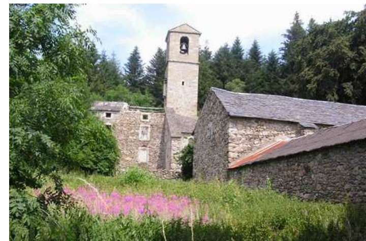
Salvergues, son église et ses épilobes

❸ En passant au milieu de quelques pittoresques maisons, le goudron apparaît. Nous le suivons désormais en enjambant à nouveau l'Agout et marchons 1,2 km avant d'accéder à la D53 au niveau du hameau de Salvergues. Nous y voyons quelques superbes bâtisses et une église de toute beauté, avec clocher visible de loin.