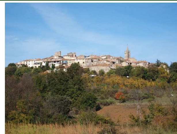
Montpezat sur sa colline

Après la traversée de Souvignargues et en fin de descente, nous allons toujours tout droit au grand carrefour et roulons 3,5 km pour nous engager à droite sur la D522 montant au village perché de Montpezat. Sans pénétrer dans le centre historique (circulade), nous allons nous garer sur un important parking dominant le site des aires de jeux et de sport. Nous constatons la présence de divers petits parkings proches.