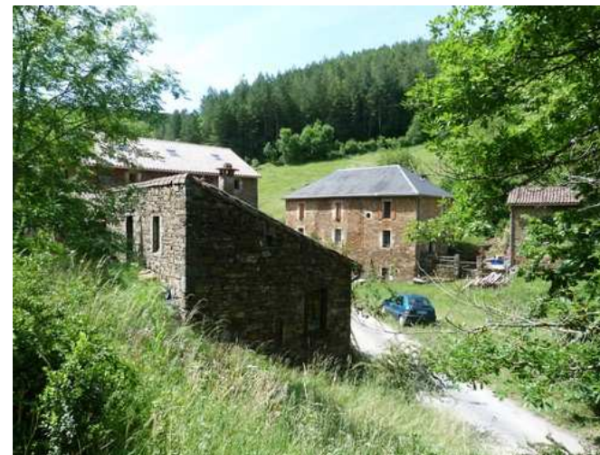
Layrolle et ses belles maisons de schiste

⑥ Une personne croisée ici nous explique qu'il existe en ces lieux un artisanat du cuir avec, comme spécialité, le "sac du berger" traditionnel. Tout est beau ici et, en plus des fleurs, nous observons en contrebas un riche jardin potager. Nous continuons ensuite sur la route et marchons 700 m environ jusqu'à une courbe à droite contournant une combe avec ruisseau.