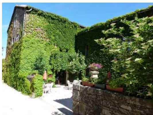
Le superbe Mas de Salel

Du parking, nous traversons l'agglomération pour descendre par une petite voie goudronnée menant au cimetière. Nous accédons très vite après à la D16.