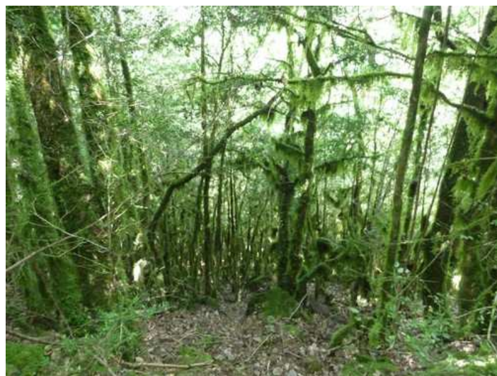
Au bord d'un ancien chemin redevenu sauvage

⑦ Vigilance en ces lieux car nous allons délaissé le macadam pour nous engager à gauche dans un tunnel végétal plutôt dense car peu passager et peu entretenu (repère : panneau d'interdiction de circulation aux véhicules). En fait, il s'agit d'un ancien large chemin qui a été délaissé par l'homme.