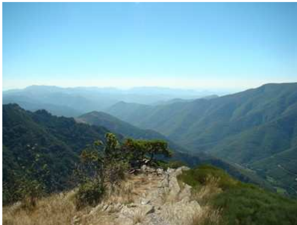
Vision de l'immensité

① Nous l'empruntons en constatant qu'outre le peu de dénivellée, nous évoluons dans un superbe milieu forestier doté de quelques épicéas et, surtout, une fantastique hêtraie avec des troncs qui s'élancent quasiment rectilignes vers le ciel. Après une marche facile d'une quarantaine de minutes, et dans un virage à gauche, nous nous approchons à droite à d'un exceptionnel point panoramique avec plongeons visuels sur les grandes étendues forestières du massif, sur la haute vallée de l'Hérault et les courbes de la D986 empruntée pour venir. Nous voyons au loin le village de l'Espérou mais aussi, sur la gauche, la ligne de crête correspondant à peu près au célèbre sentier des 4 000 marches venant de Valleraugue.