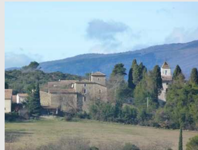
Villesèque vu de loin

⑨ Nous accédons au cours d'eau le Vergalous qu'il nous faut passer aisément par un gué. À partir de là vigilance car, 200 m ensuite, c'est à gauche que nous continuons puis à droite et encore à gauche juste après. Le chemin se rapproche du ruisseau et atteint la D8. Par la gauche, nous retrouvons rapidement Logrian.