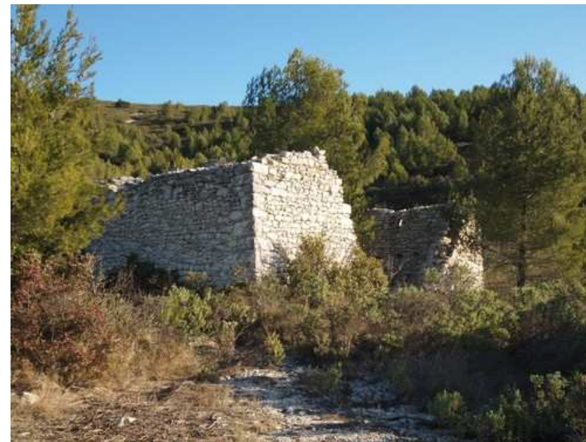
Superbe ruine sur le chemin

De notre emplacement de parking, nous marchons le long de la D764 jusqu'à l'axe routier de la D990 situé 300 m plus loin. Nous le traversons pour partir en face, entre une entreprise à droite et une bâtisse à gauche (chambres d'hôtes), sur un chemin menant au Serre du Suc. Nous suivons en fait un balisage jaune. Dans un premier temps, nous montons un peu et, après un virage à droite, nous atteignons, au niveau d'une autre piste, un bâtiment ruiné en pierre. Une arche en place nous fait penser à une bergerie. Toujours en suivant le jaune, nous montons par le biais d'un sentier dallé de plaques de calcaire. Nous y constatons la présence d'empreintes de fossiles marins, globalement des ammonites.