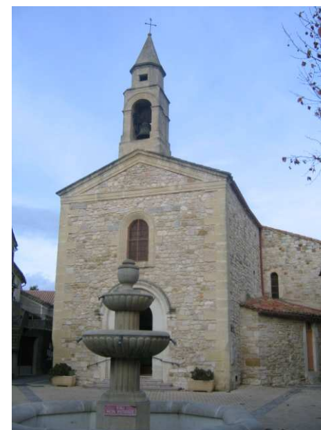
Eglise de Fons-outre-Gardon

Du parking, nous partons immédiatement sous le passage voûté vers l'église pour rejoindre la rue Haute qui nous mène à la sortie du village. Une piste goudronnée perpendiculaire, dotée du balisage rouge et blanc du GR163, se présente. Cet itinéraire correspond au chemin des Jasses .