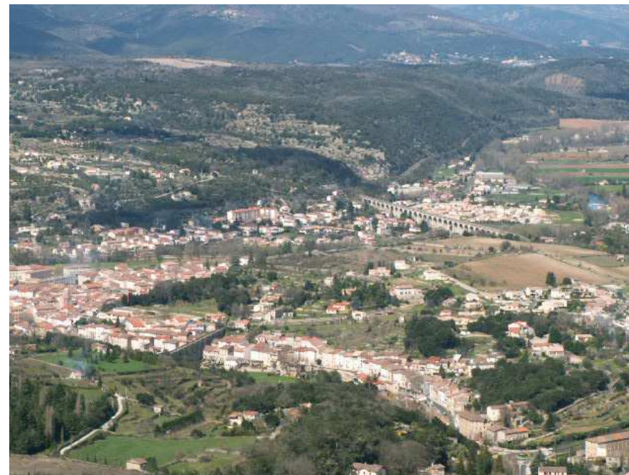
Bédarieux et son superbe viaduc

Du fond du parking, nous remontons sur la petite rue d'accès pour récupérer une ruelle transversale qui aboutit à la D908. Nous la traversons car nous devons prendre, juste en face, le chemin de Clairac. Nous sommes au niveau du faubourg Saint-Louis. Il faut alors nous avancer pour enjamber la voie ferrée et suivre cette petite route qui va monter conséquemment pendant 1,4 km.