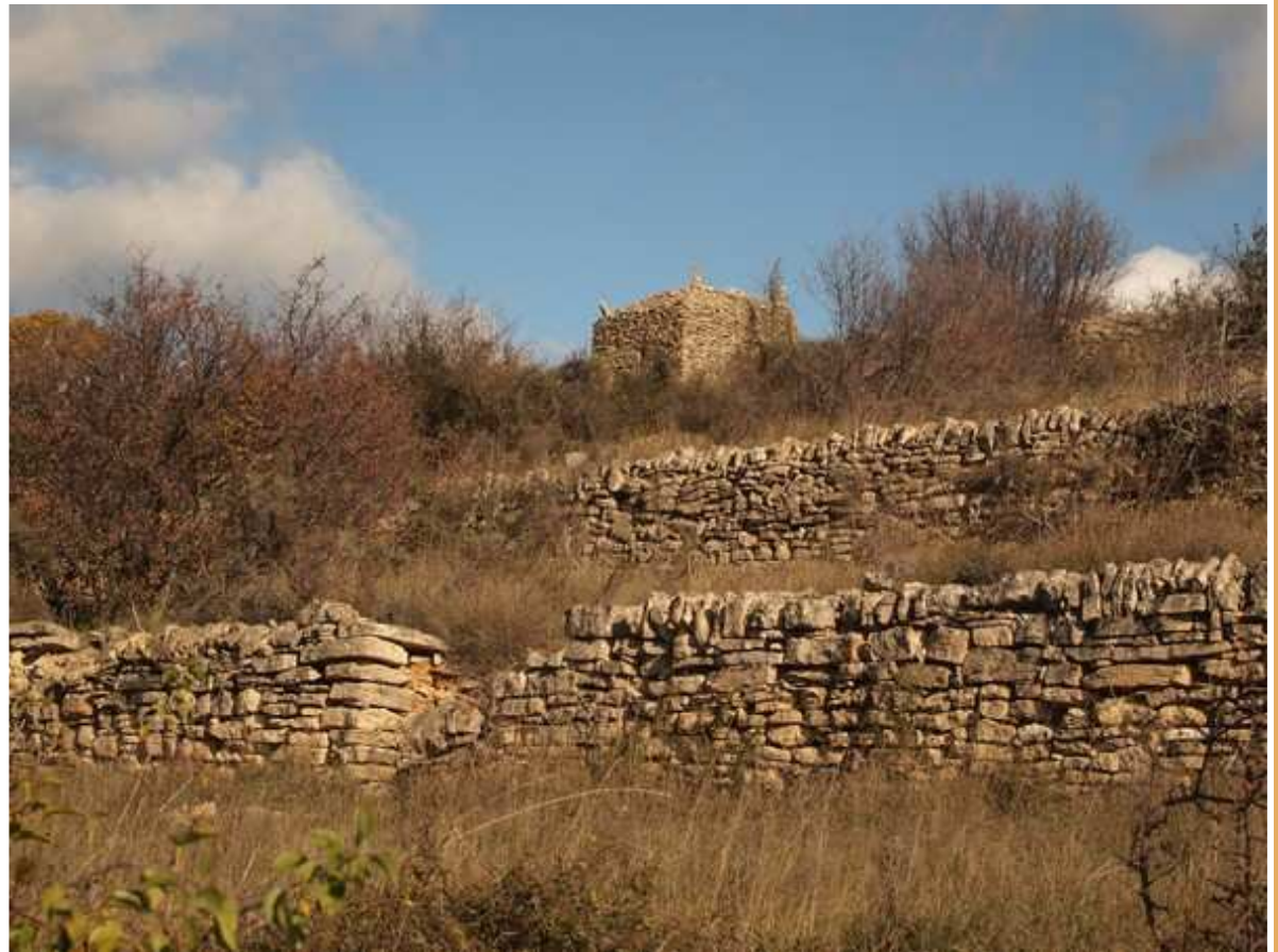
L'une des superbes capitelles le long de notre rando

⑥ A cet endroit, nous retrouvons le balisage bleu partant sur la droite, sur un chemin quelque peu dégradé qui, en descendant, nous permet d'accéder rapidement à la D35, route allant de Bédarieux à La Tour-sur-Orb. Avec prudence, nous partons à droite pour, 150 m après, partir à gauche sur le pont enjambant l'Orb et se dirigeant, par cette D157, jusqu'au Mas-Blanc. Nous observons à gauche l'église du hameau que nous traversons rapidement pour arriver au niveau d'un petit pont à droite enjambant le cours d'eau Vernoubrel.