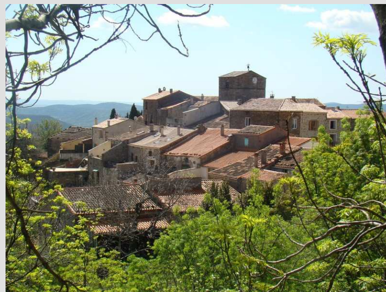
Le beau village de Soumont

Il faut faire particulièrement attention en fin de rando à la circulation automobile de la D609. Le long de la Lergue, on découvre les nombreux bâtiments des anciennes manufactures dont la machinerie fonctionnait grâce à la force hydraulique, en témoignent les nombreux petits barrages et canaux dérivants amenant l'eau aux turbines.