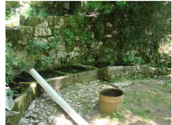
Une des fonts de La Bastide