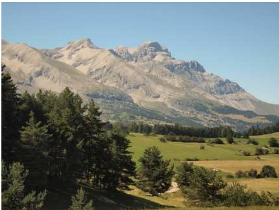
L'Obiou, sommet du Dévoluy

③ A droite, on peut rejoindre la grande station Superdévoluy que nous évitons car ne présentant pas d'intérêt dans l'immédiat. Nous préférons continuer en face, toujours en descendant tranquillement et en jouissant de la beauté de ce grandiose environnement.