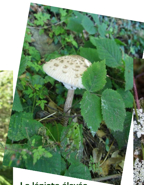
La lépote élevée