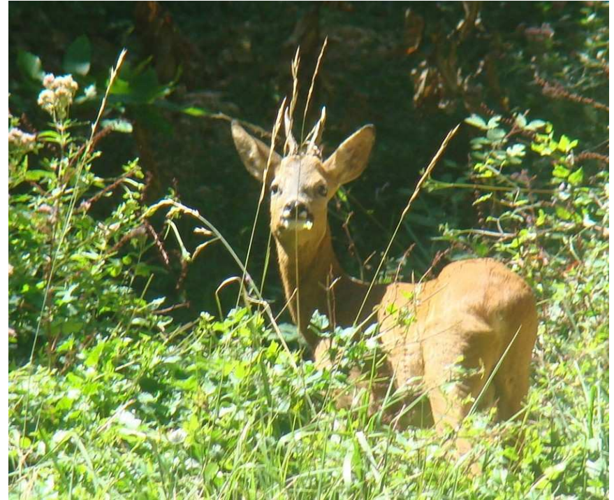
La surprise d'un chevreuil

À noter que, peu après, et juste après un virage, une superbe surprise nous attend. Il ne nous a pas entendus ni sentis. Nous nous immobilisons car un chevreuil mâle est en train de consommer des végétaux sur la gauche du chemin. Nous faisons silence pour l'observer. Nous avons l'opportunité de prendre quelques photos avant qu'un petit déclic n'alerte l'animal après cinq minutes environ. À cet instant, il tourne sa tête vers nous et nous offre la possibilité de l'immortaliser (photo ci-contre). Le voici qui dévale en contrebas. Quels instants magiques ! En continuant sur cette partie commune, nous retrouvons après 40 minutes la voiture.